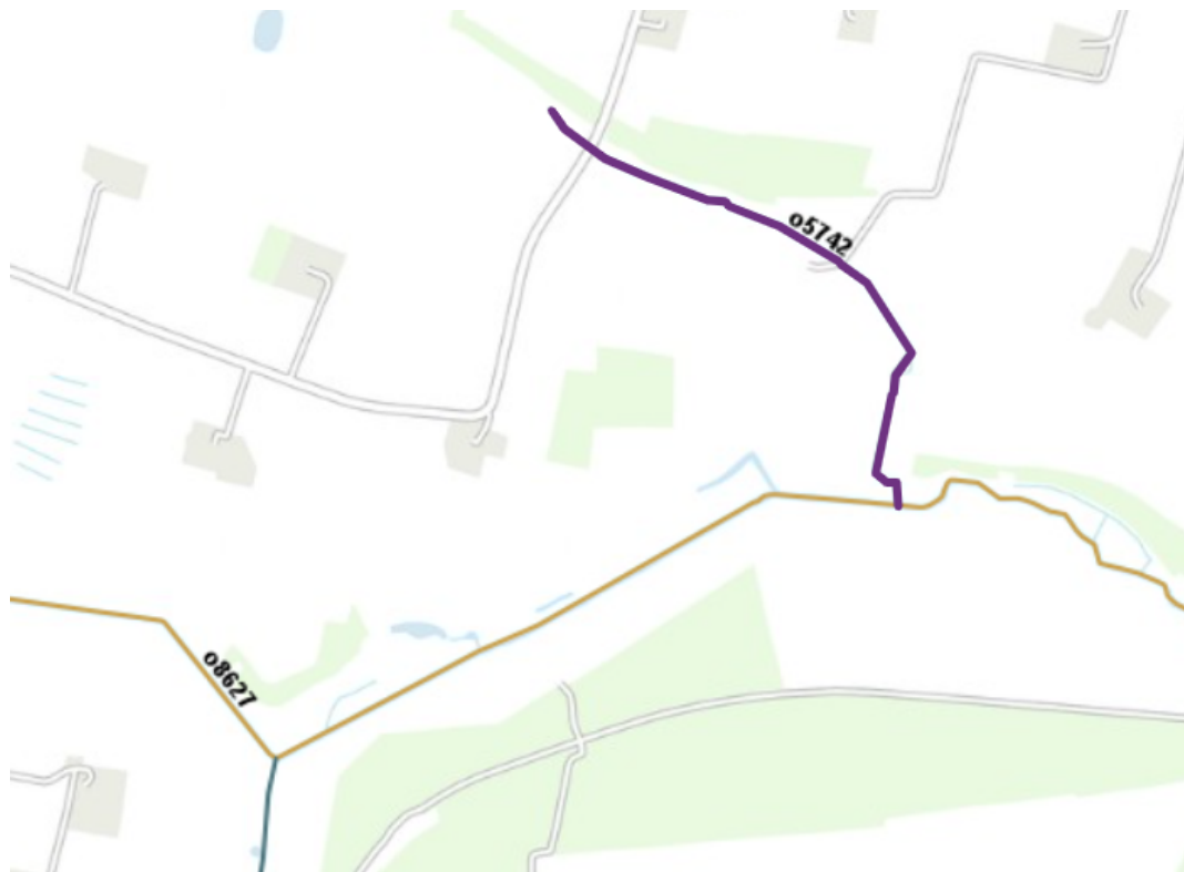
Figur 1. Vandområde o5742 Stenhøje Grøft.

Efter vandområdeplan 2021 – 2027 omfatter indsatsen mindre strækningsbaserede restaureringer.