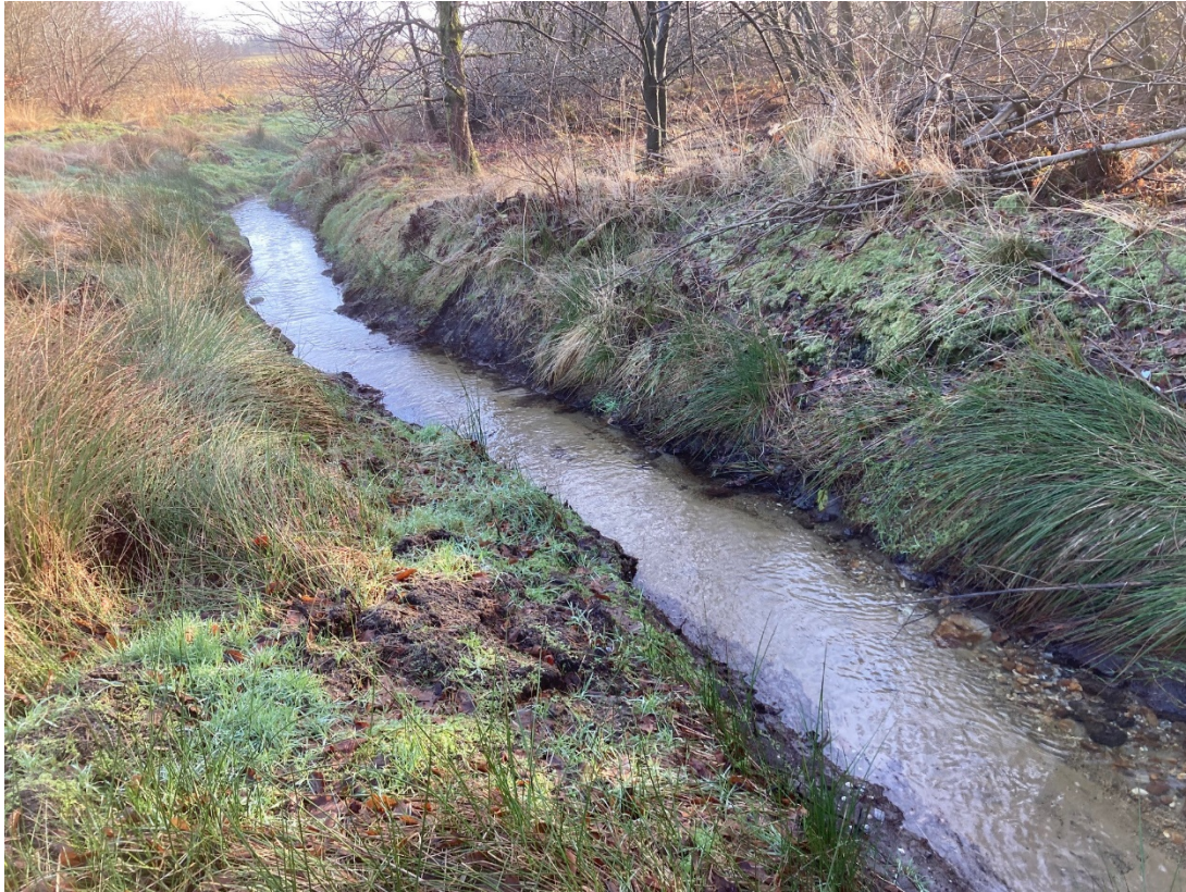
Foto 2. Stenhøje Grøft