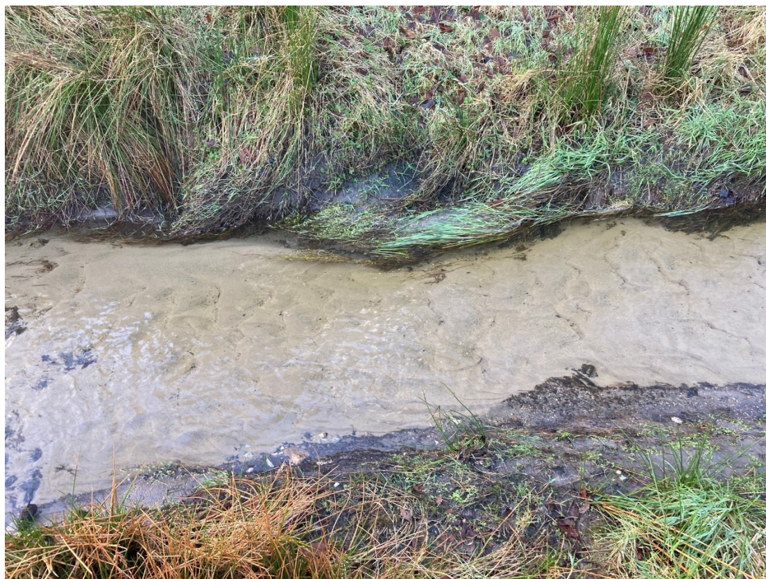
Foto 1. Stenhøje Grøft

Plantevæksten er domineret af vandstjerne og pindsvineknop.